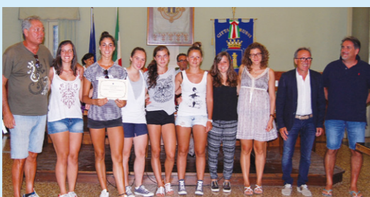
Premiazione dell'Olimpia Russi Volley Under 18, terza classificata alle Finali Nazionali di Volley CSI U18. Le ragazze dell'Olimpia hanno battuto il Napoli, il Lodi e, nella finale 3°-4° posto, il Rosaltiora-Verbania.