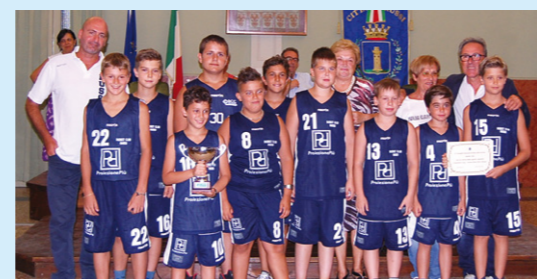
Premiazione del gruppo Aquilotti 2004 Basket Club Russi, vincitore del Torneo Rione Nero Faenza.