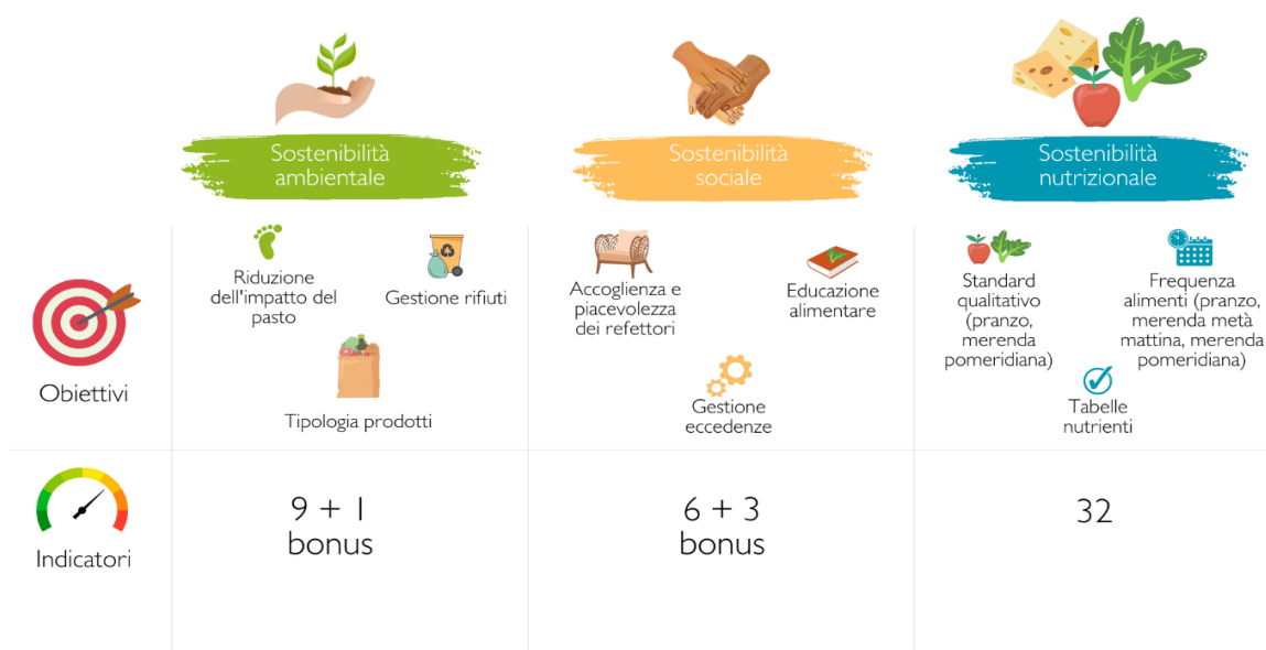
Figura 2. Obiettivi e indicatori del Toolkit di valutazione di sostenibilità integrata.

La Figura 2 presenta invece obiettivi e numero di indicatori per ogni pilastro della sostenibilità.